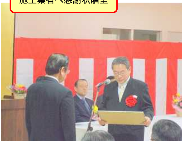
施工業者へ感謝状贈呈