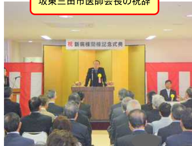
坂東三田市医師会長の祝辞