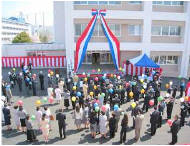
オープンセレモニーのはじまりです