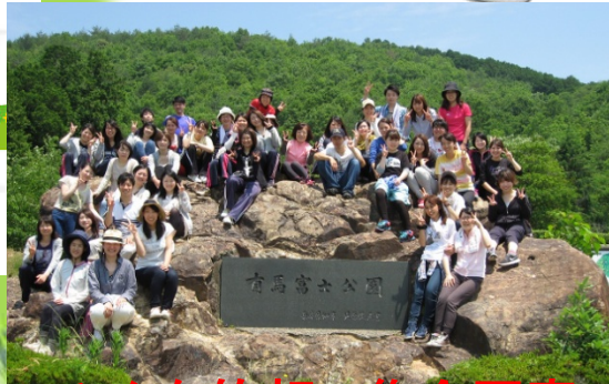
みんな笑顔で集合写真