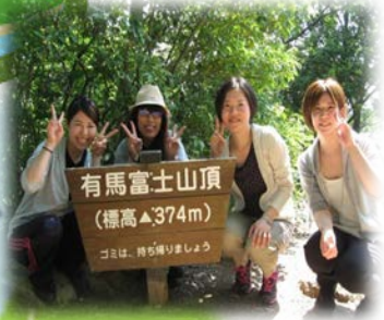
山頂でハイ！ポーズ

5月30日(土)有馬富士公園にて、プリセプティ・プリセプター合同研修が行われました。参加者40名。8時30分職員駐車場に集合し、徒歩で有馬富士公園へ向かいました。まず、広場でストレッチ。いよいよスタート！今年はルート4で、有馬富士山頂を目指すコースでした。晴天に恵まれ、プリセプター・プリセプティが同じ目標をめざして行動する中でお互いを知り親睦を深められた研修でした。