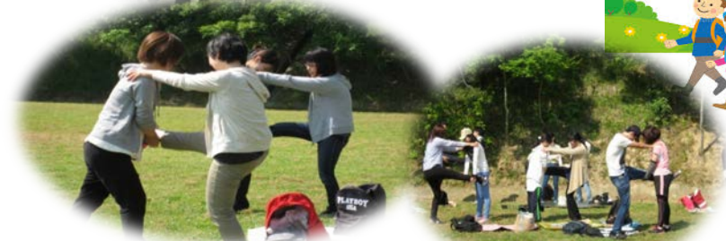
ストレッチで体をほぐしましょう～♪